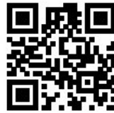
「釣りレポ」ホームページのQRコード

アクセス出来たら会員登録の為、facebookログインボタンをクリックしてください。会員登録のページに移ります。